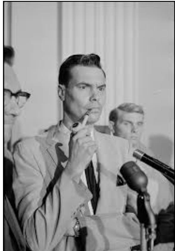
George Lincoln Rockwell

Najdôležitejšími sú neopísaní hrdinovia - minulí, súčasní aj budúci -, ktorí sú pred-